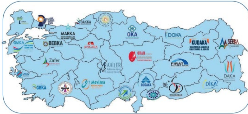
Şekil 1: Kalkınma Ajansları

25.01.2006 tarih ve 5449 sayılı “Kalkınma Ajanslarının Kuruluşu, Koordinasyonu ve Görevleri Hakkında Kanun” çerçevesinde Türkiye’nin 81 ilini kapsayacak şekilde Türkiye’de 26 bölgede kalkınma ajanslarının kuruluş süreci başlamıştır.